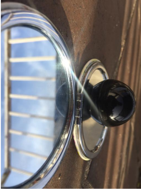
Safa Chaudhry Chaudhry 2n batxillerat "Infinit en un viatge interdimensional a través del cristall"